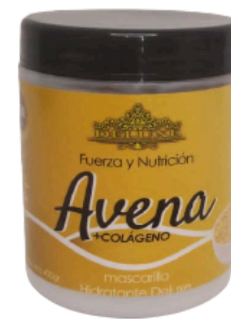
Nutrición, Mascarilla de Avena