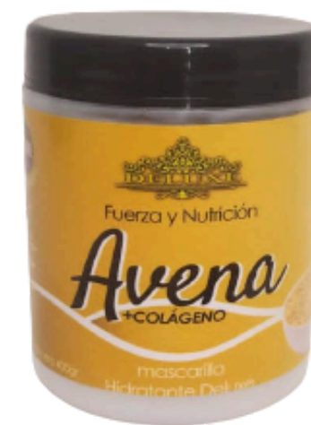
Nutrición, Mascarilla de Avena