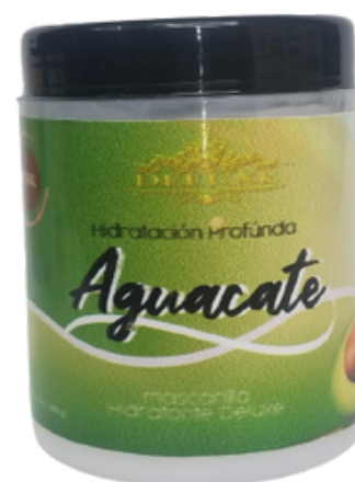
Hidratación, Mascarilla de aguacate