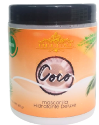
Reparación, Mascarilla de Coco