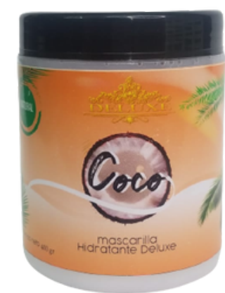
Reparación, Mascarilla de Coco