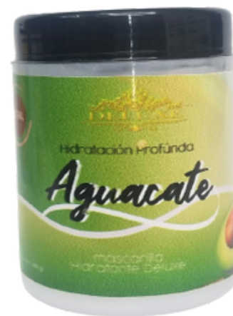
Hidratación, Mascarilla de aguacate